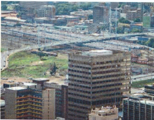
Nelson Mandela Brücke