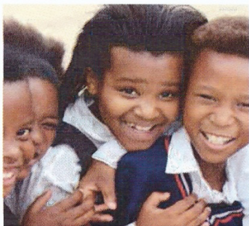
Schüler*innen in Conakry, Guinea, Quelle: Oumar Diallo, Afrikahaus/Farafina e. V.

und Mädchen in Deutschland, Westafrika und im südlichen Afrika gibt und gehen der Frage nach, wie Chancengleichheit hergestellt werden kann.