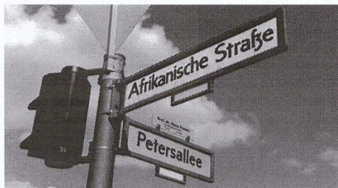
Deutsche Kolonialspuren

Am Beispiel des Afrikanischen Viertels in Berlin-Wedding gehen wir der Frage nach, wie sich die Spuren der deutschen Kolonialgeschichte und das heutige lebendige afrikanische Leben aufeinander beziehen. Wir fragen, wie viele Menschen afrikanischer Herkunft heute in Berlin leben und wie sie die Stadt und unseren Blick auf die Welt verändern. Wir diskutieren, inwieweit die Bewohner*innen des Afrikanischen Viertels das koloniale Denkmal umwidmen.