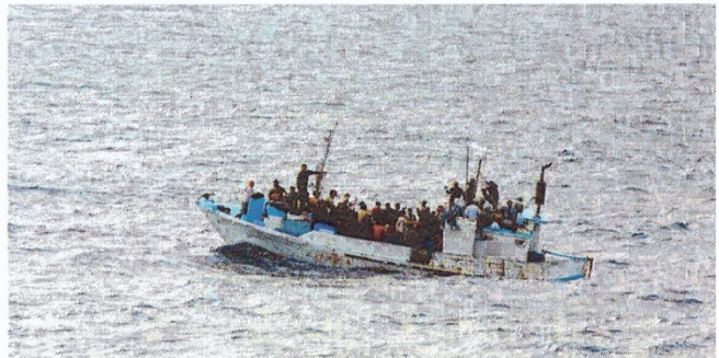
Flüchtlingsschiff, Quelle: Bangoura Mamadi

Es gibt viele minderjährige afrikanische Flüchtlinge, die sich ohne Eltern und teils auf abenteuerlichen und gefährlichen Wegen aufgemacht haben, um in Deutschland um Asyl zu bitten. Wir informieren Euch über Fluchtursachen, Fluchtwege und die Schwierigkeiten im Alltag von unbegleiteten minderjährigen Flüchtlingen hier in Berlin. Gemeinsam gehen wir der Frage nach, wie ein tolerantes und respektvolles Miteinander aussehen kann.