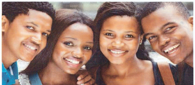
Oberschüler*innen in Labe, Guinea, Quelle: Oumar Diallo, Afrikahaus/Farafina e. V.